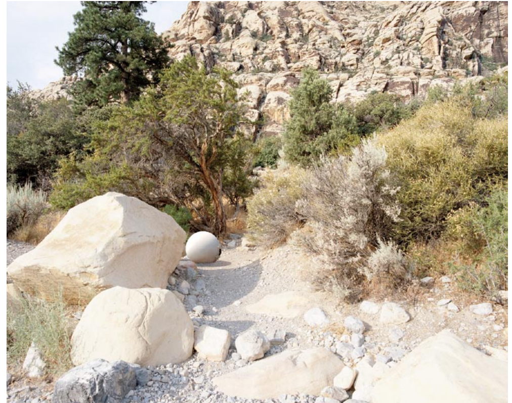
Irhann 02, 2008, 76x89 cm.