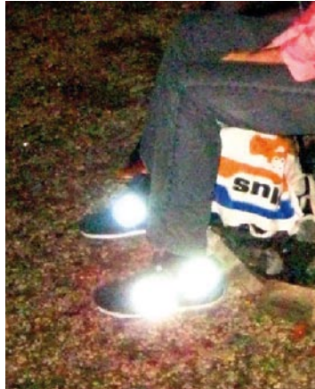
3, 2009, 76x95 cm. Ed. 7+2 AP