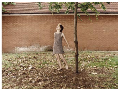
Remembering in Somewhere on time , 2004, 109x146 cm, Ed. 5+2 AP.