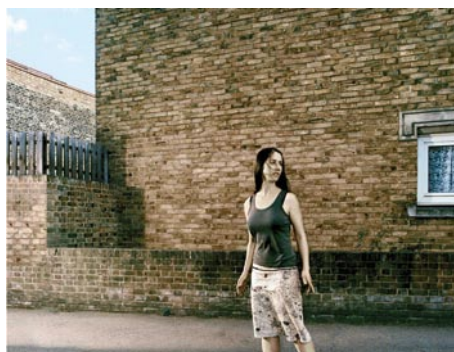
Escape in Somewhere on time , 2004, 109x141 cm, Ed. 5+2 AP