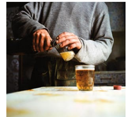
Morning, in Gorelovka