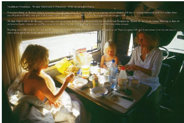
Í húsbílnum í Frakklandi Mit dem Wohnmobil in Frankreich With the camper in France, 2004/05, 33 x 43cm.