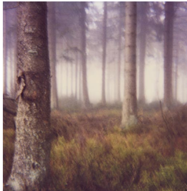
Lapsun prompta #13